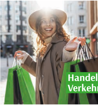
Handel | Verkehr