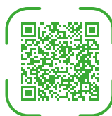
Broschüre Lehre mit Matura

Weitere Informationen und Details finden Sie in unserer Informationsbroschüre und erfahren Sie beim verpflichtend zu besuchenden Informationsabend.