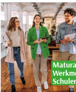
Matura, Werkmeister, Schulen