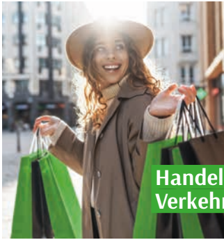
Handel | Verkehr