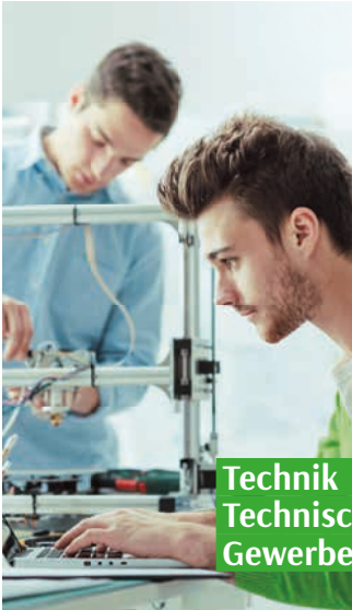
Technik | Technisches Gewerbe