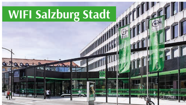
WIFI Salzburg Stadt

Unser Ziel ist es, dass Sie bei uns die Aus- und Weiterbildung finden, die perfekt zu Ihnen bzw. Ihren Mitarbeiter:innen passt. Unser Kundenservice beantwortet gerne Ihre Fragen.