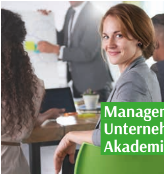
Management | Unternehmensführung | Akademische Ausbildung