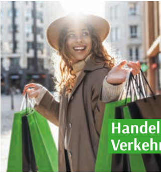
Handel | Verkehr