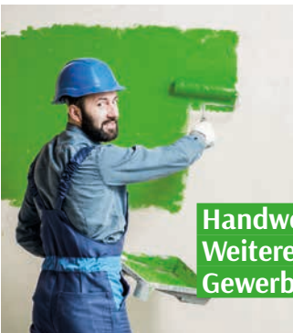
Handwerk | Weitere Gewerbe