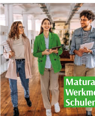
Matura, Werkmeister, Schulen