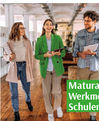
Matura, Werkmeister, Schulen